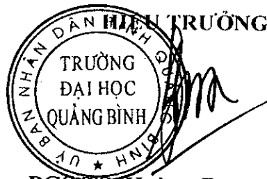
PGS.TS. Hoàng Dương Hùng

4. Cán bộ, giảng viên, viên chức, người lao động và người học tại Nhà trường có trách nhiệm thực hiện theo đúng các quy định về PCCC&CNCH của Nhà nước và Nhà trường./.